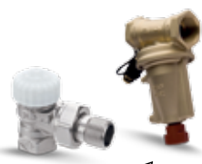
V exact II & STAP

Presiunea disponibilă este relativ ridicată pe anumite elemente ale sistemului datorită mărimii extinse a instalației. Regulatele de presiune sau controlul presiunii diferențiale sunt necesare sau nu sunt configurate corespunzător.