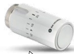
Gama de capete termostate IMI Heimeier

Luțați în considerare înlocuirea capetelor termostat pentru o performanță mai bună.