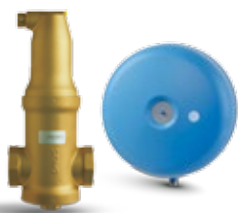
Separatoare de aer Zeparo și Statico